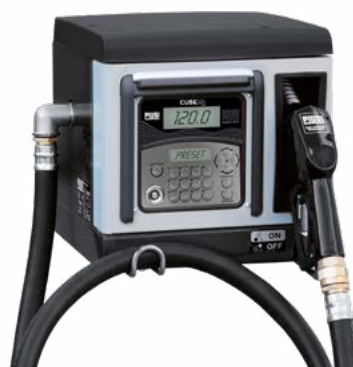
CUBE 70 MC