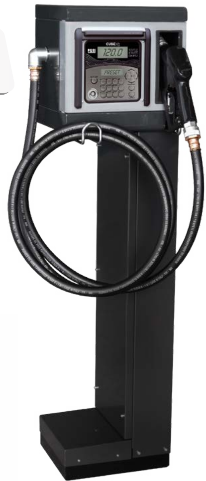
CUBE 70 MC MIT SOCKEL (OPTIONAL)

Upgrade ihrer MC-hardware auf B.Smart mit dem upgrade Kit hardware 1.0/2018